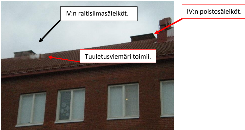
Kuva 2. Kuvassa olevan tuuletusviemäriin vasemmalla puolella on tulpattu tuuletusviemäri.