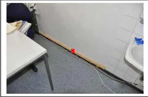
Ilmaisu 1: Luokka 2.24