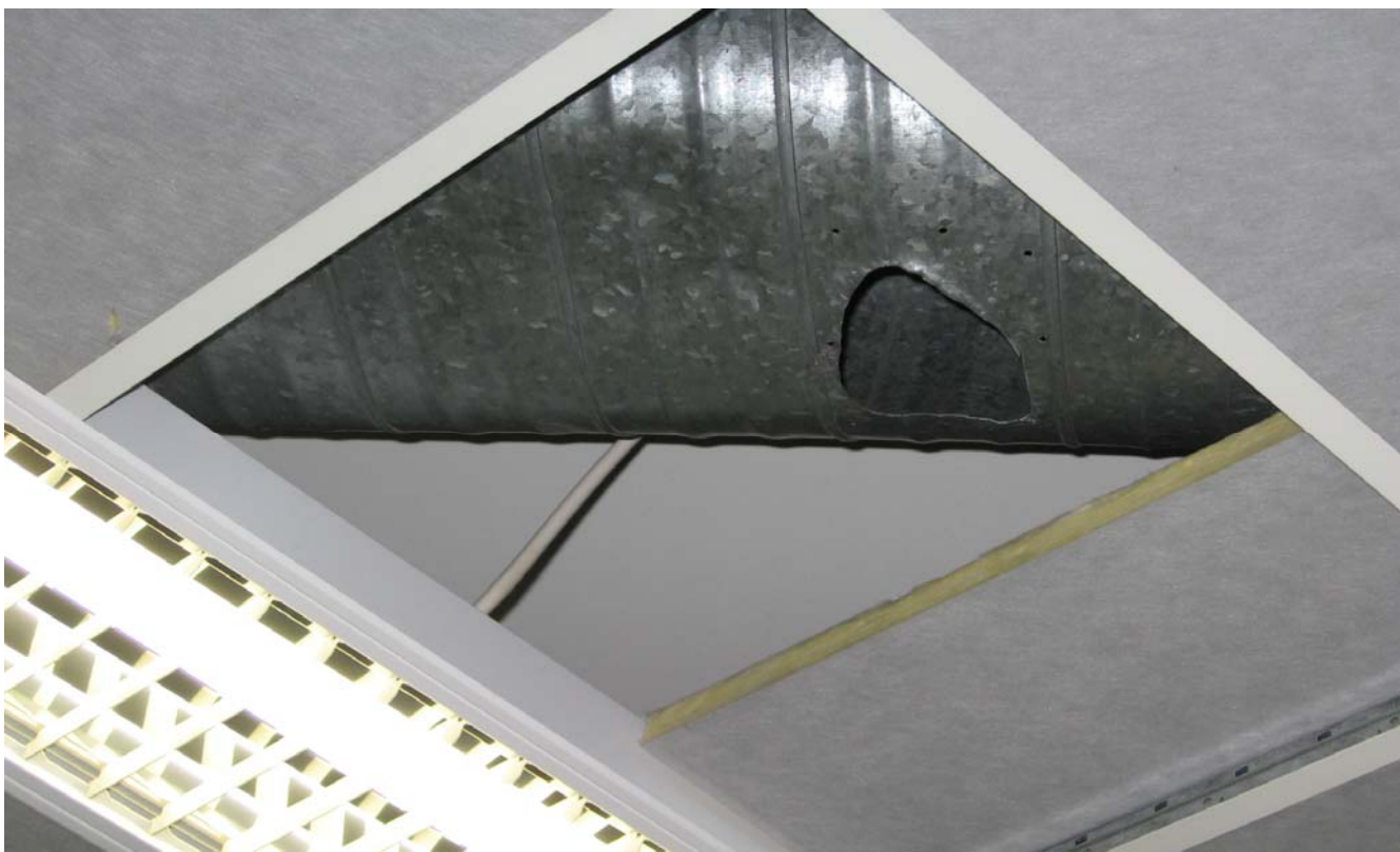
KUVA 4. Tuloilmakanavassa on reikä.