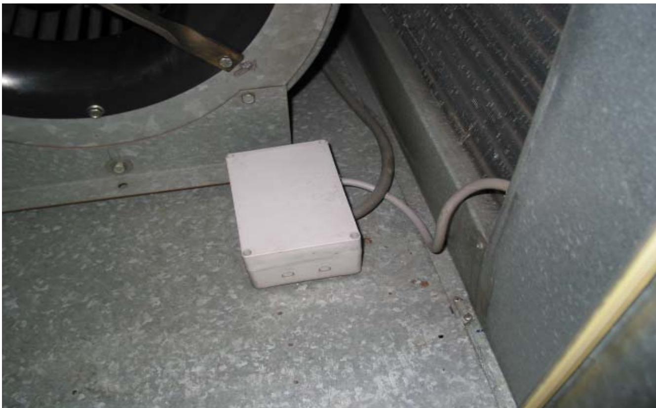
KUVA 2. Tuloilmakone on melko puhdas.