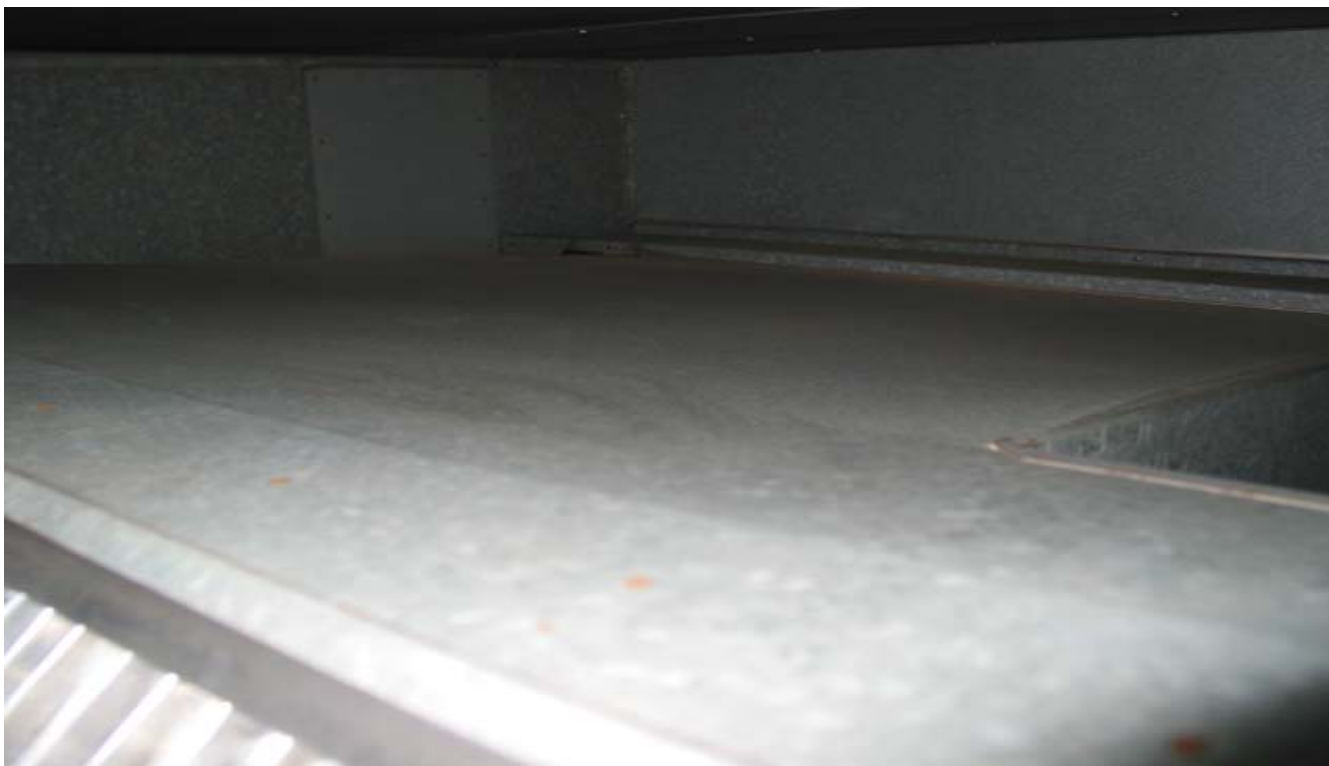
KUVA 3. Tuloilmakammio on puhdas.