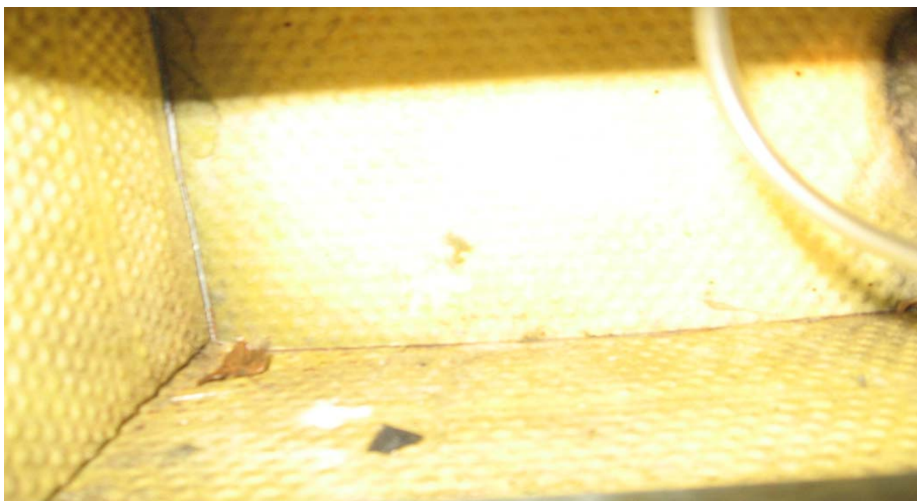
KUVA 6. Lepohuoneen n:o 41 tasauslaatikossa on puunlehtiä.