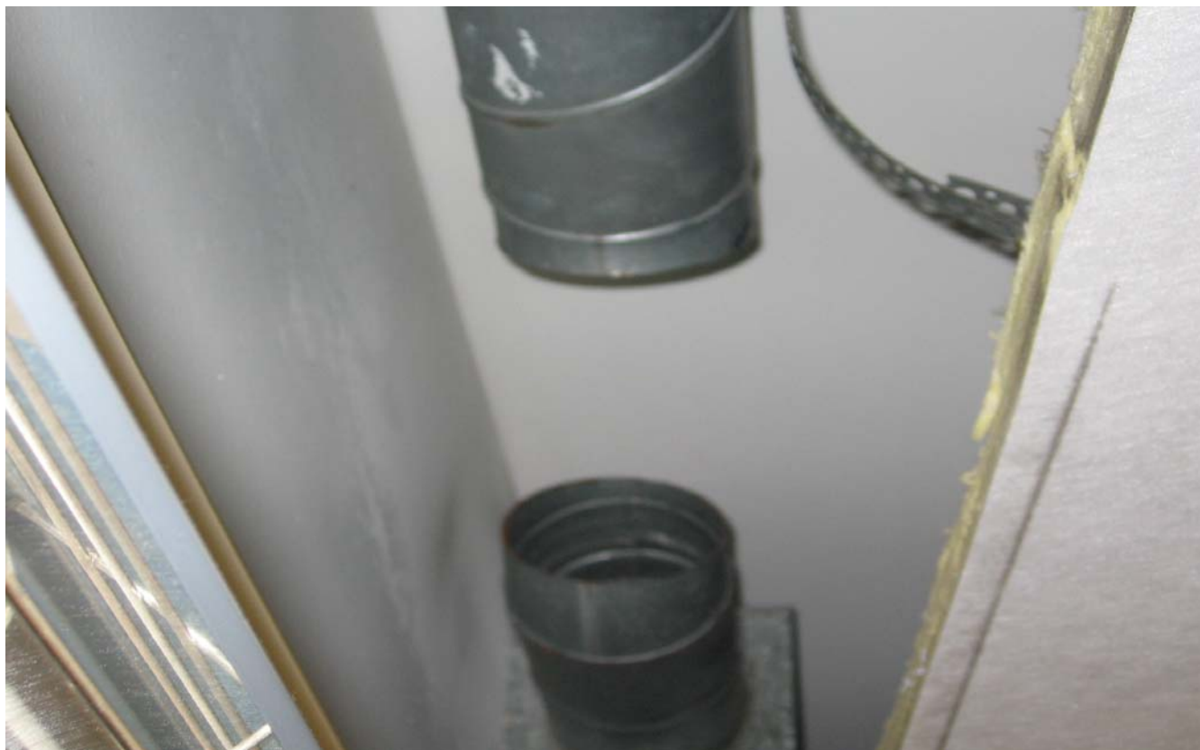
KUVA 5. Leikkihuoneesta n:o 13 puuttuu IV- kanava.