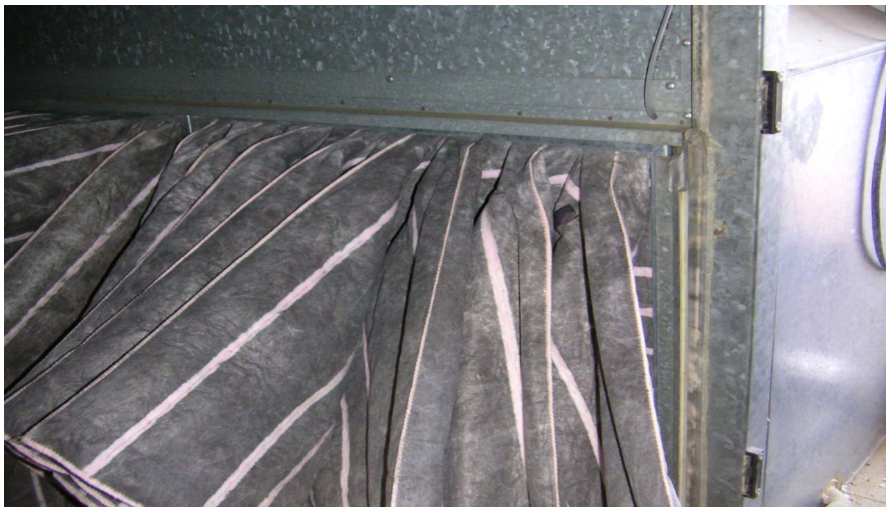
KUVA 5. Suodattimista tapahtuu ohivirtausta (= suodattamaton ilma pääsee huoneilmaan).