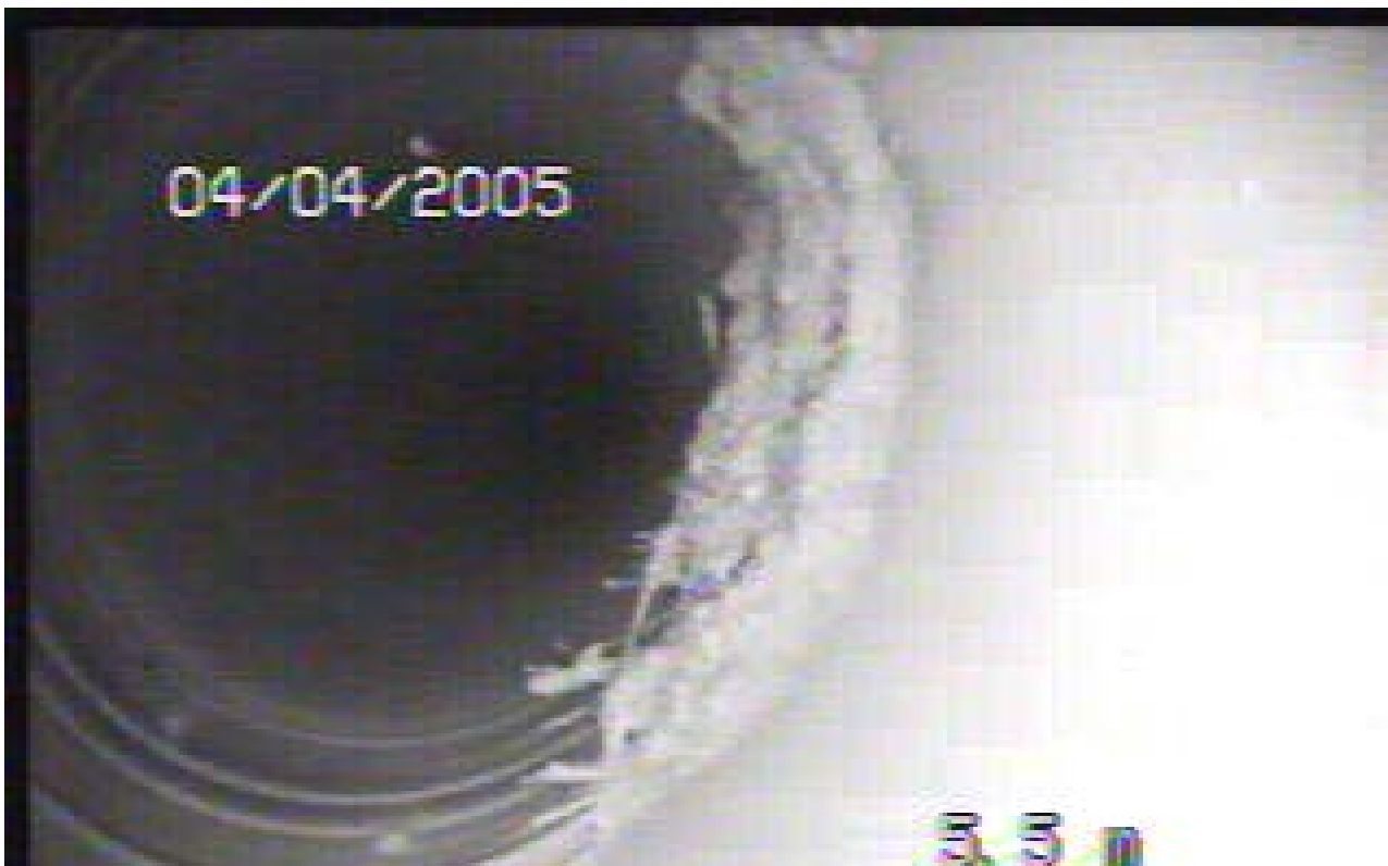
KUVA 6. Poistoilmakanavan pohjalla on pölykertymää.