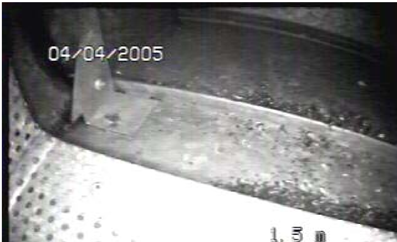
KUVA 1. Tuloilmakanavan pohjalla on melko paljon roskaa.