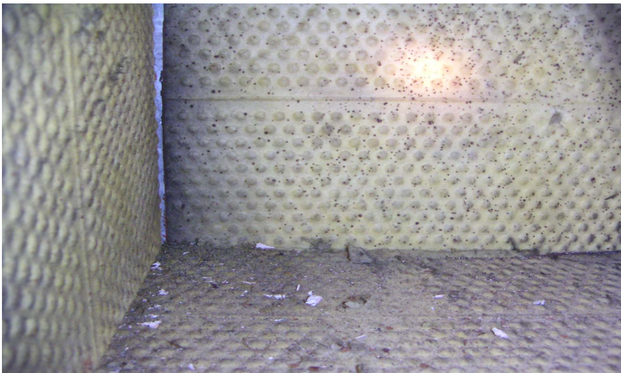
KUVA 3. Tasauslaaticoissa on paljon roskaa ja villan kappaleita.