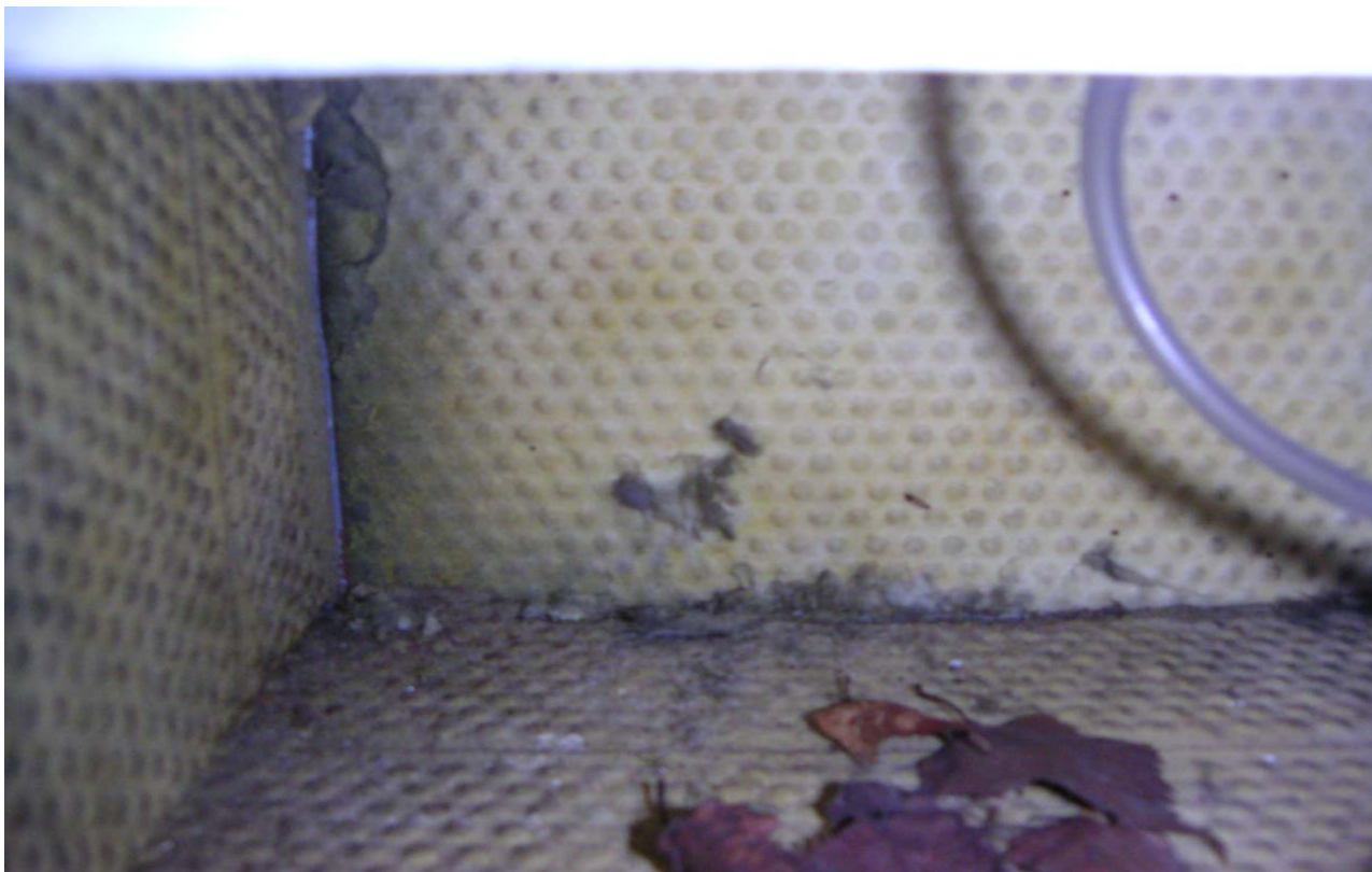
KUVA 2. Tasauslaaticoissa on paljon roskaa.