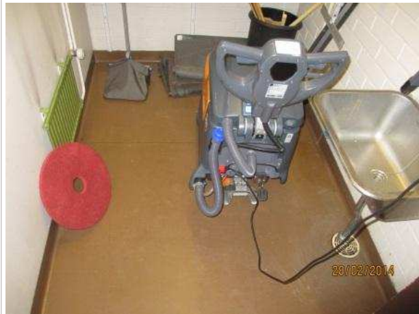
23. SIIVOUSKOMERO 072, lattian muovimaton alla on kohonnutta kosteutta lattiakaivon ympärillä.