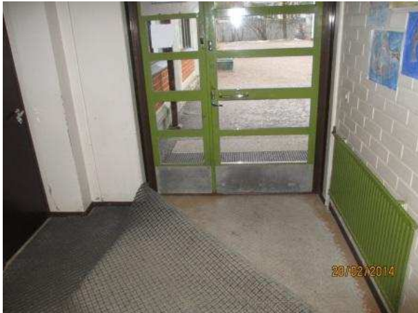
24. TUULIKAAPPI 101, lattiabetonissa on kohonnutta kosteutta ulko-oven edessä. Lattian maalipinta on kulunut ja lattiabetonissa on rapautumisvauriota.

Lattian muovimaton kiinnityksen seuranta.