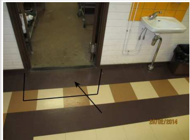
39. RUOKASALI 162, lattialaittojen alla on kohonnutta kosteutta astianpesutilan oviaukon edessä.