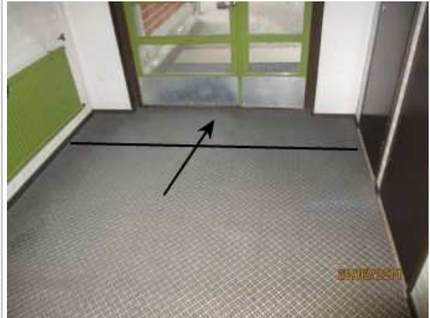
35. TUULIKAAPPI 154, betonilattiasa on kohonnutta kosteutta ulko-ovien edessä. Betonilattian pinta on rapautunut ja lattiassa on halkeamia.