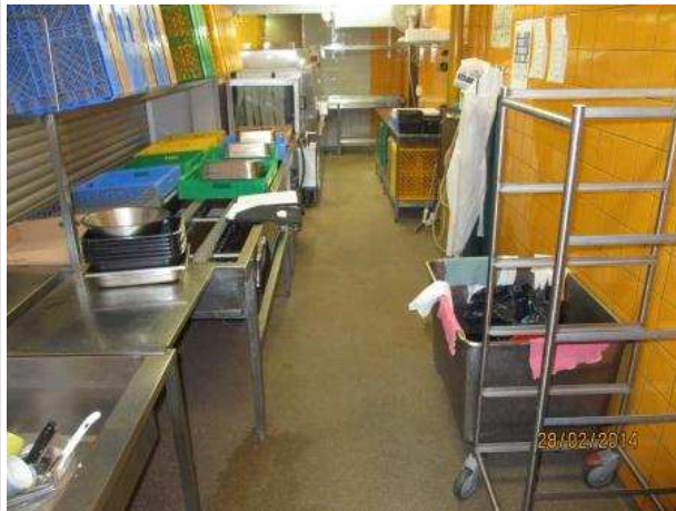
40. ASTIANPESU 163, oikean sivuseinän alimpien seinälaattojen alla on kohonnutta kosteutta 2 m leveydellä.