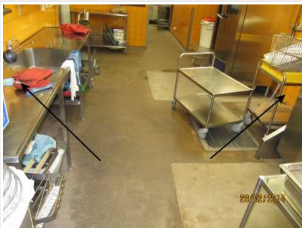
42. KEITTIÖ 168, seinälaattojen alla on kohonnutta kosteutta 0,5 m korkeuteen patojen ja uunien takana sekä työtasojen takana.