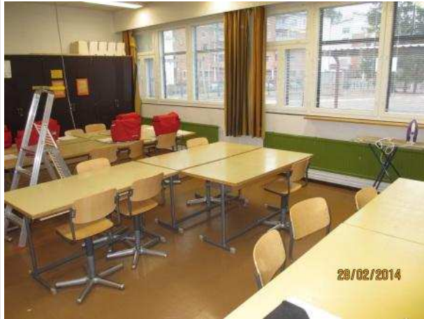
5. TEKSTIILITYÖ 030, lattian pintamateriaalina on vinyylilaatta, lattiassa ei ole kohonnutta kosteutta.