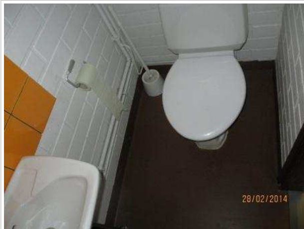
1. WC 005, lattian muovimaton alla on kohonnutta kosteutta. Matto on hyvin kiinni lattiassa.