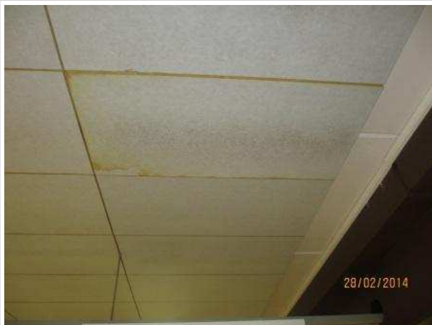
38. RUOKASALI 162, yhdessä katon akustolevyssä on kosteuden aiheuttama vauriojälki.