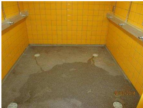
19. SUIHKUHUONE 063, seinälaattojen alla on kohonnutta kosteutta 0,3 m korkeuteen, alimpia seinälaattoja on haljennut.