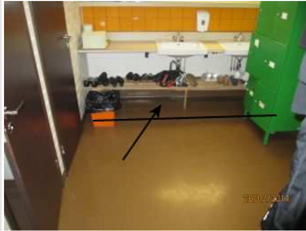
28. WC 116, lattian muovimaton alla on kohonnutta kosteutta takaseinän vieressä pesuallaiden alapuolella.