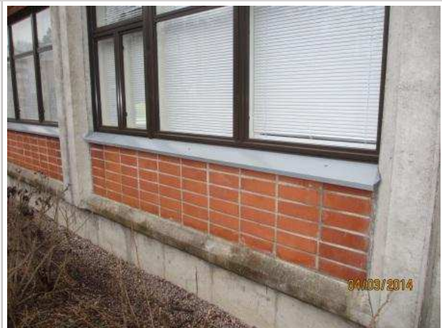
48. JULKISIVU, kuva puu- ja metallityösalin kohdalta. Ikkunan vesipeltiä ei ole kiinnitetty seinärakenteeseen.