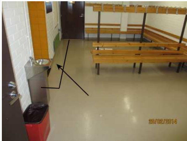
17. PUKUHUONE 059, lattian muovimaton alla on kohonnutta kosteutta suihkuhuoneen vastaisen seinän vieressä ja oviaukon edessä.