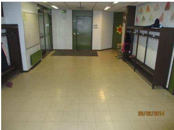
26. AULA 106, lattiassa ei ole kohonnutta kosteutta.