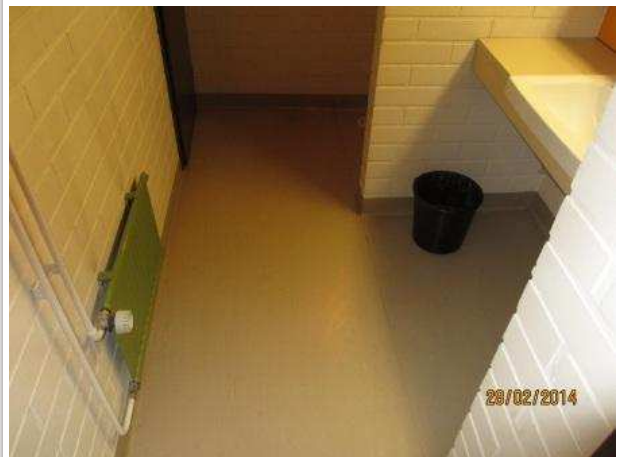
16. WC 057, seinissä ja lattiassa ei ole kohonnutta kosteutta.