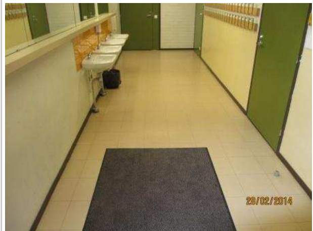
8. PUKEUTUMINEN 035, lattiassa ja seinissä ei ole kohonnutta kosteutta.