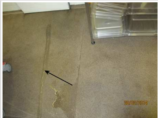
43. KEITTIÖ 168, lattian massapinnotteessa on useita halkeamia.