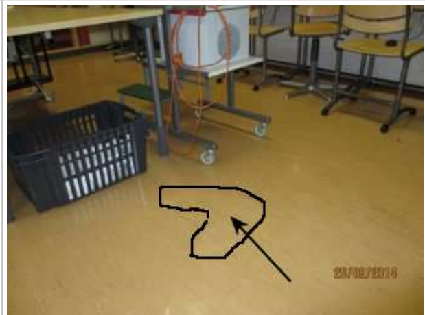
31. KIRJASTO 127, lattian muovimatto on irronnut paikoitellen alustasta. Kuvaan merkitty yksi vauriokohta.