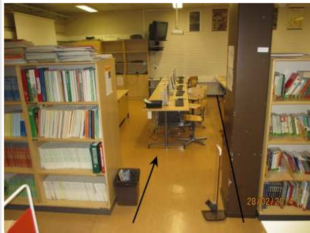
32. KIRJASTO 127, lattian pintamateriaalin on muovimatto, lattiassa on kohonneita lukemia oviaukosta takaseinälle.