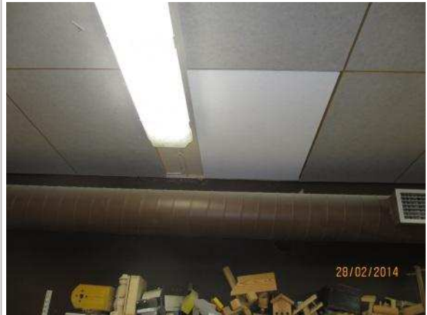
4. PUU- JA METALLITYÖ 029, katon betonipalkin kyljessä on maalivaurioita kattovuodon seurauksena.