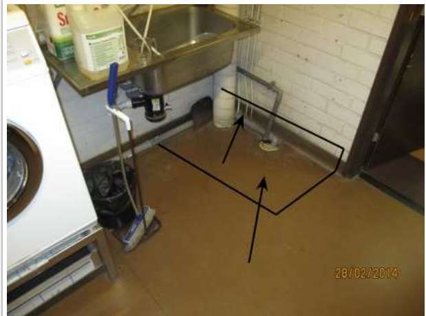
33. SIIVOUSKOMERO 128, lattian muovimaton alla on kohonnutta kosteutta lattiakaivon vieressä 0,5 m 2 alalla. Väliseinän tiiliseinän alaosa on kastunut lattiakaivon vierestä. Vesiputkien läpiviennit lattiasta vuotavat, alapuolella olevan varaston katosta tippuu vettä.