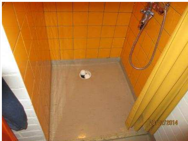
21. OPETTAJIEN PESUHUONE 067, lattian muovimaton alla on kohonnutta kosteutta lattiakaivon ympärillä. Muovimatto on irti alustasta lattiakaivon ympäriltä 5 cm säteellä.