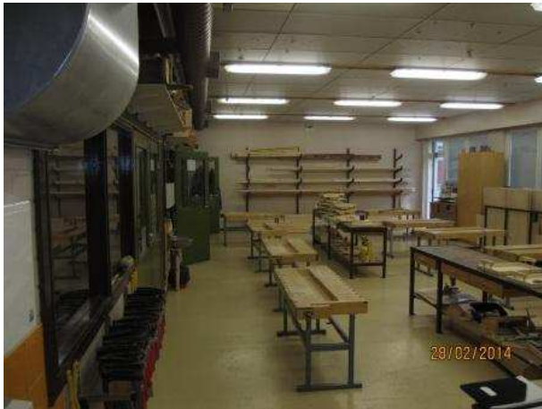
3. PUU- JA METALLITYÖ 029