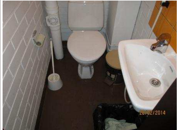
25. WC 102, lattian muovimaton alla on kohonnutta kosteutta wc-istuimen ympärillä. Matto on irti lattiasta wc-istuimen edestä.