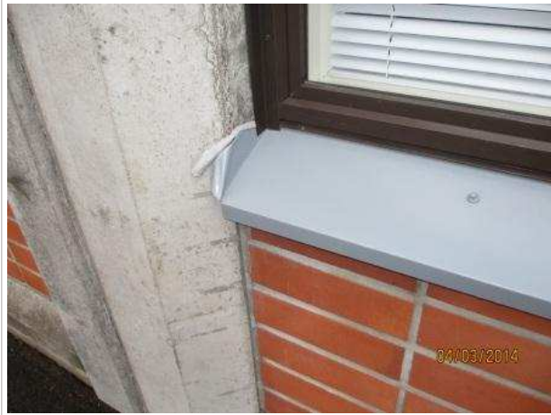
49. JULKISIVU, ikkunoiden vesipeltien päiden ja seinän liitoskohta on puutteellisesti tiivistetty.