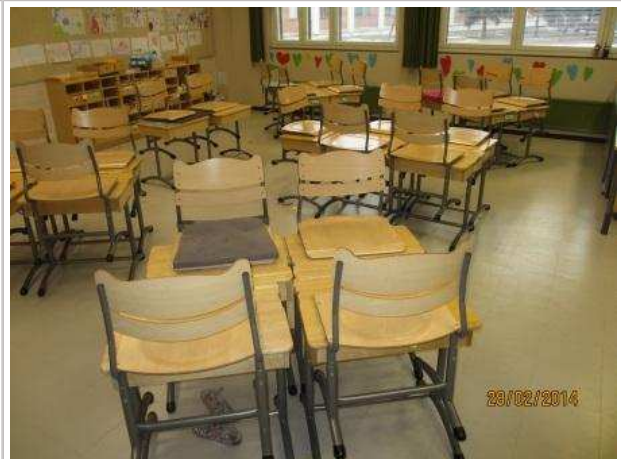
2. OPETUSTILA 007, lattian pintamateriaalina on vinyylilaatta, lattiassa ei ole kohonnutta kosteutta.