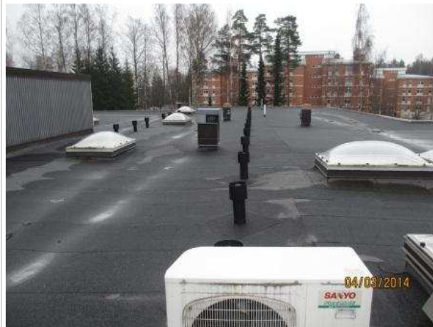
45. VESIKATTO, kate on uusittu muutama vuosi sitten. Vesikatteessa ei ole vaurioita.