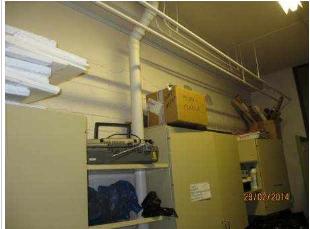
6. VARASTO 031, oikean sivuseinän yläosassa on vaakasuuntainen halkeama.