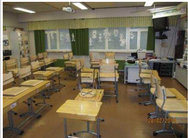
27. OPETUSTILA 107, lattiassa ja seinissä ei ole kohonnutta kosteutta.