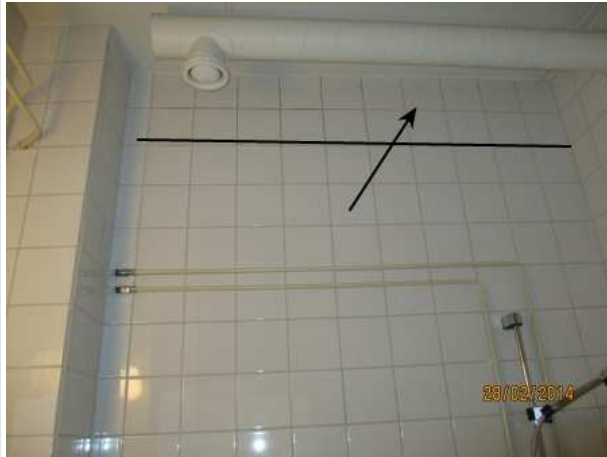
34. SIIVOOJIEN SOSIAALITILAN WC 147, takaseinän yläosassa seinälaittojen alla on kohonnutta kosteutta 0,3 m katosta alaspäin.