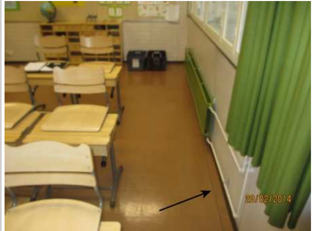
12. OPETUSTILA 043, betonilattia on liikkunut alaspäin ulkoseinän vieressä, seinän suuntainen laattasauma on auki.