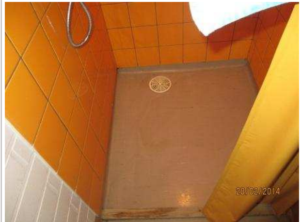
18. OPETTAJIEN PESUHUONE 060, lattian muovimaton alla on kohonnutta kosteutta ja matto on irti alustasta lattiakaivon ympäriltä.