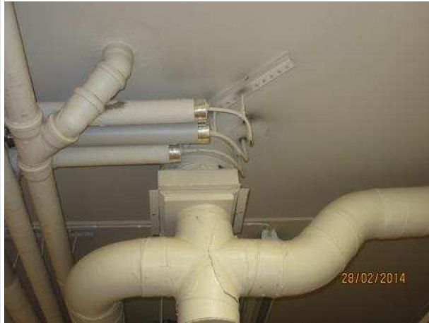
11. VARASTO 040, katosta tippuu vettä vesiputkien läpiviennin kohdalta.