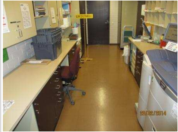
29. MONISTAMOHUONE 124, lattiassa on kohonneita lukemia koko huoneen alalla.