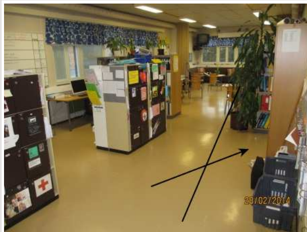
30. OPETTAJIEN HUONE 125, lattiassa on kohonneita lukemia kirjaston ja monistamohuoneen vastaisen seinän vieressä.