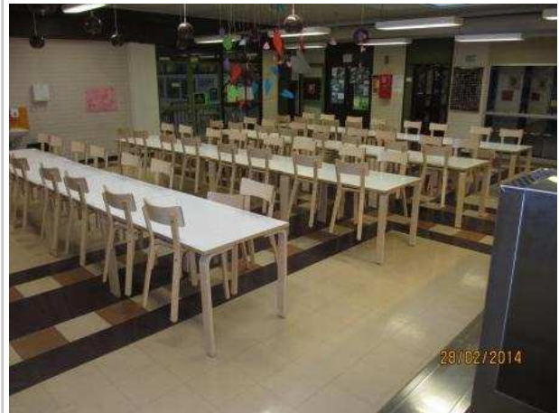
37. RUOKASALI 162