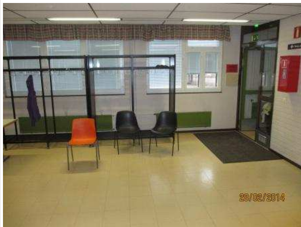
15. AULA 053, lattiassa ja seinissä ei ole kohonnutta kosteutta. Ulkoseinässä on elementtisaumassa halkeama.