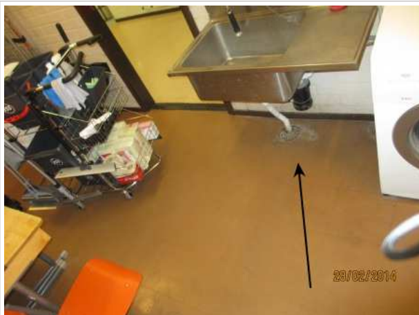
9. SIIVOUSKESKUS 037, lattilaattojen alla on kohonnutta kosteutta pesualtaan alapuolella 1 m 2 alalla.