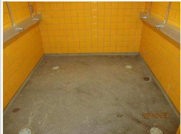
20. SUIHKUHUONE 064, seinälaattojen alla on kohonnutta kosteutta 0,5 m korkeuteen. Alimpia seinälaattoja on haljennut.