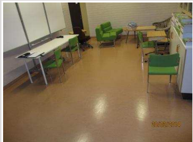
10. VARASTO 040, lattian muovimaton alla ei ole kohonnutta kosteutta.