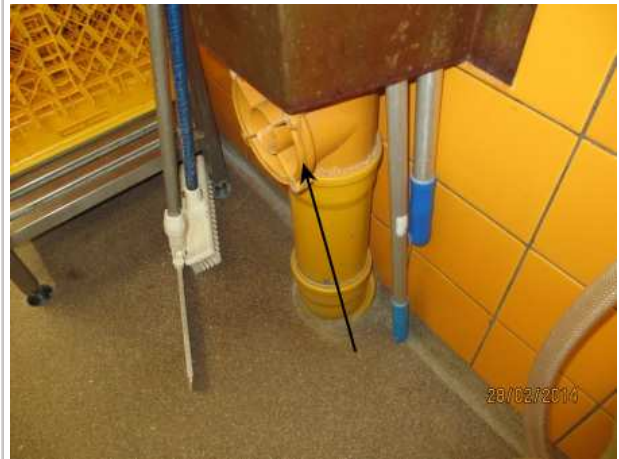
41. ASTIANPESU 163, viemäriputken puhdistusluukun kohdalta tulee viemärihajuja.