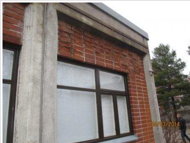
47. JULKISIVU, ulkoseinien tiililaatoissa on pakkasrapautumaa. Tiililaatoista on irronnut kappaleita.