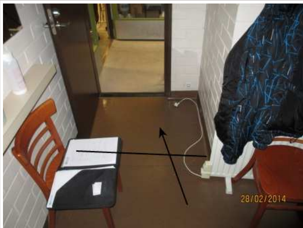
44. HENKILÖKUNNAN SOSIAALITILA 171, lattian muovimaton alla on kohonnutta kosteutta oviaukon edessä 1 m 2 alalla.