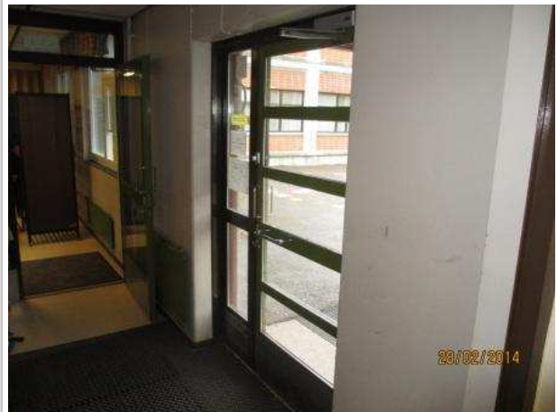
14. TUULIKAAPPI 052, lattiassa on kohonnutta kosteutta ulko-oven edessä. Ulkoseinässä on maalivauriota ulko-oven yläpuolella.