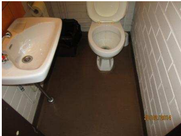
36. WC 157, lattian muovimaton alla on kohonnutta kosteutta koko tilan alalla. Seinissä ei ole kohonnutta kosteutta.