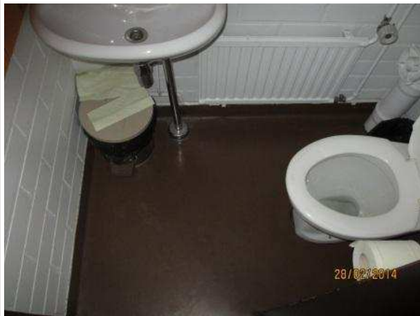
13. WC 050, muovimatto on huonosti kiinni vasemman sivuseinän vieressä. Seinissä ja lattiassa ei ole kohonnutta kosteutta.