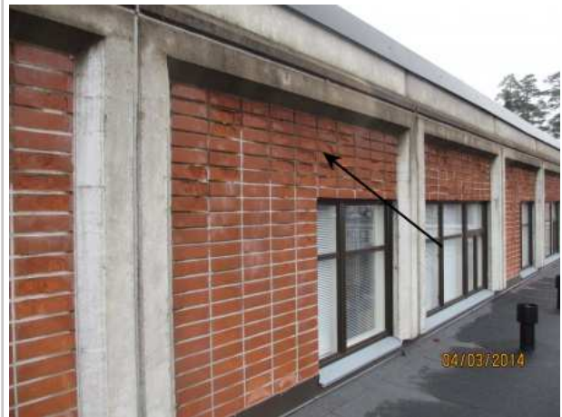
46. JULKISIVU, ulkoseinien tiililaatoissa on pakkasrapautumaa. Tiililaatoista on irronnut kappaleita.