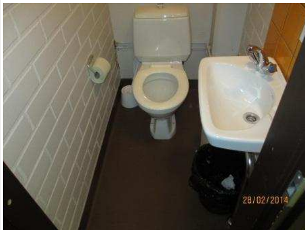
7. WC 018, lattian muovimaton alla on kohonnutta kosteutta. Matto on hyvin kiinni lattiassa.