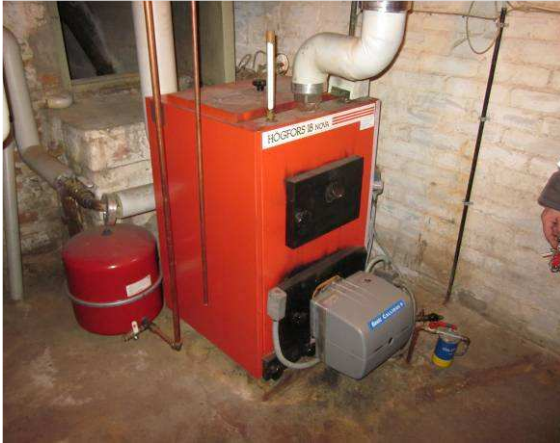
Öljypoltin on noin 2 vuotta vanha