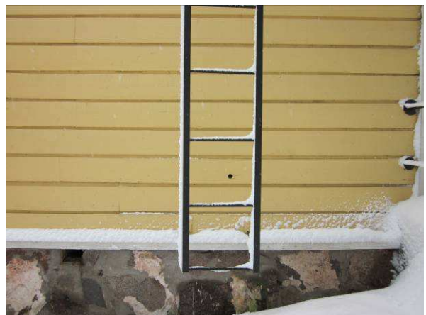
Talotikkaiden huoltomaalaus ajankohtaista jakson alkupuolella