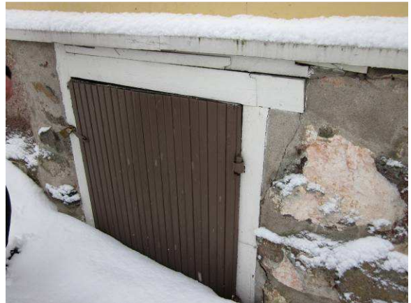
Kuvaa kellarikerroksen päädyn ovesta, tilaan ei lumitilanteen takia päästy