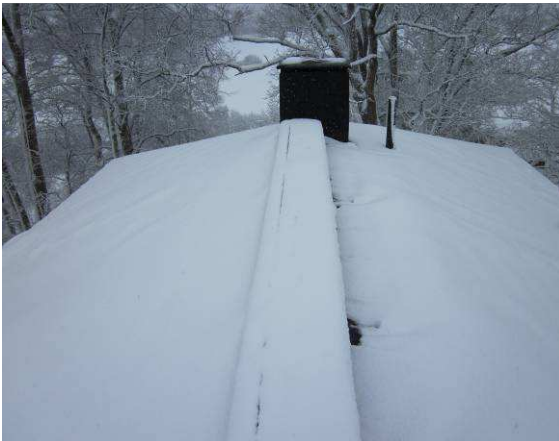
Yleiskuvaa vesikatolta. Katto oli kohdekäynnin aikana lumen peitossa

Kattovesien pois ohjaus tapahtuu räystäskourujen kautta syöksytorviin ja siitä rakennuksen vierustalle. Räystäskourut ovat välttävissä kunnossa. Muutamassa kohdin havaittiin räystäskourujen ja syöksytorvien kiinnitysten pettäneen. Suositellaan räystäskourujen ja syöksytorvien korjaamista ja tarvittaessa uusimista jakson alussa. Rakennuksen vesikatoille on kulku yläpohjatilan kautta kattoluukusta ja rakennuksen päädyistä talotikkailta.