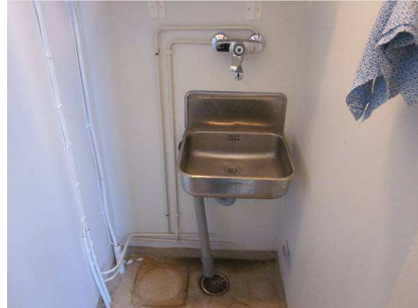
Hyväkuntoinen tasapohja-allas sekottajineen