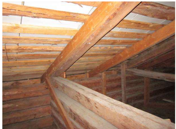
Kuvaa yläpohjan runkorakenteista