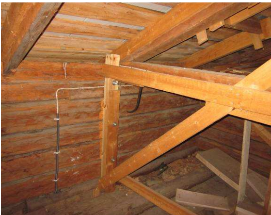
Hirsirungon yläpään leviäminen on estetty pulttaamalla ja lisätuilla