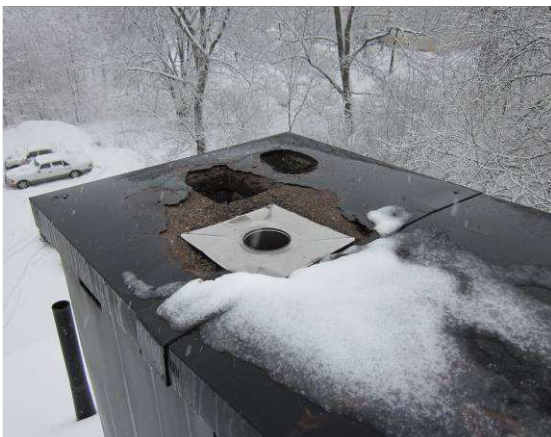
Luonnollisia poistohormeja katolla

Painovoimaisessa ilmanvaihdossa kanavat voidaan nuohota tarpeen mukaan. Mitään ohjeistusta kymmenen vuoden välein tehtävästä nuohouksesta koneellisen ilmanvaihdon tapaan ei kuitenkaan ole.