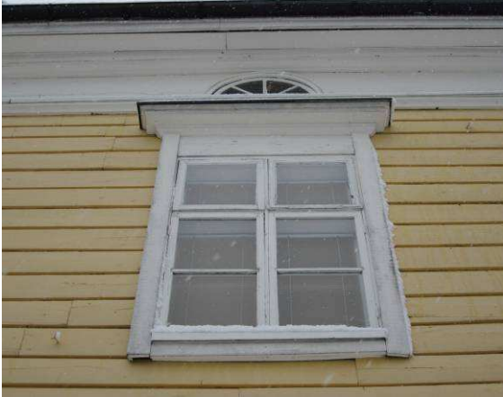
Yleiskuvaa rakennuksen ikkunasta