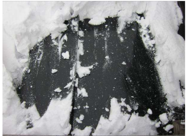
Kate on uusittu hiljattain