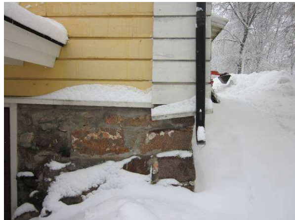
Kattovedet valuvat syöksytorvista rakennuksen vierustalle