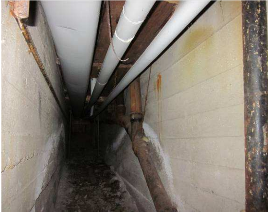
Vanhoja kokoojaviemäreitä ja putkieristystä