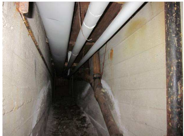
Kuvaa kellarikerroksen betonirakenteista