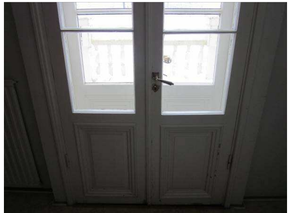
Kuvaa kaksilehtisestä parvekkeen puuovesta