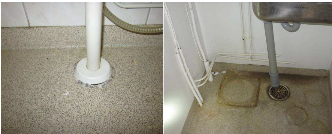
Puutteellisesti tiivistetystä läpivientikohdasta vesi on päässyt rakenteisiin, kohdassa aistittavissa mikrobiperäinen haju

Kohteen märkätilojen muovimatoissa havaittiin joitakin puutteellisesti tiivistettyjä läpivientejä ja paikoin kynnysnostot puuttuivat. Suihkuvesi on voinut näistä syistä johtuen päästä rakenteisiin ja vaurioittaa niitä. Suositellaan lisätutkimuksia märkä/kosteisiin tiloihin tarkemman korjaustarpeen määrittämiseksi.