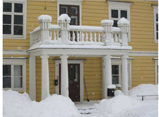
Kuvaa rakennuksen parvekkeesta