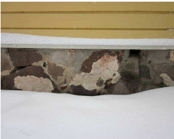
Kuvaa talon luonnonkivistä muuratusta sokkelista

Yleisesti perustusten ja rungon kunto on tyydyttävä.