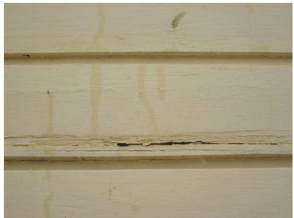
Ulkooverhouksissa paikoin kunnostustarvetta