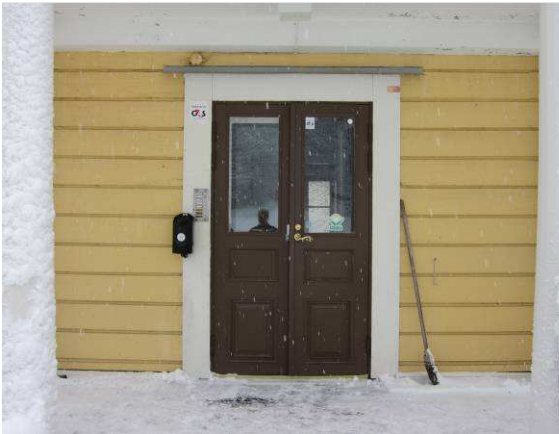
Kuvaa pääovesta, oven saa auki repäisemällä