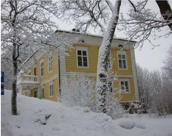
Julkisivukuvaa rakennuksen päädystä