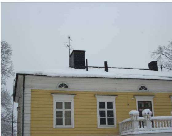
Räystäskourun kiinnitys pettänyt