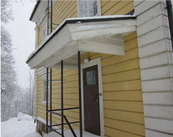
Kuvaa puurakenteisista sisääntulolipasta