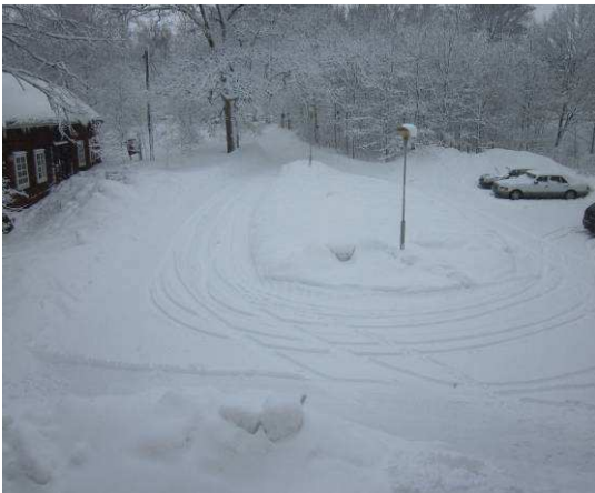
Kuvaa rakennuksen etupihalta

Yleisesti ulko-alueet ovat tyydyttävässä - välttävissä kunnossa.