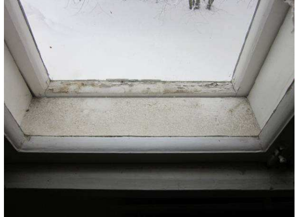
Rakennuksen ikkunat ovat kaksilehtisiä, kaksilasisia puuikkunoita