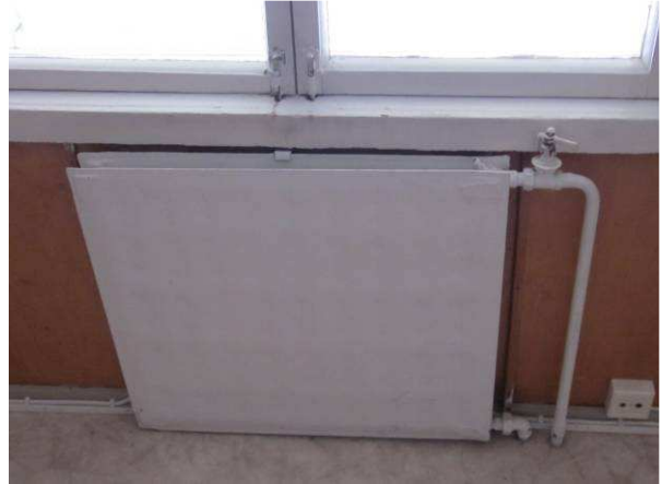
Alkuperäinen patteriventtiili, pattereiden kannakkeet laajasti irti