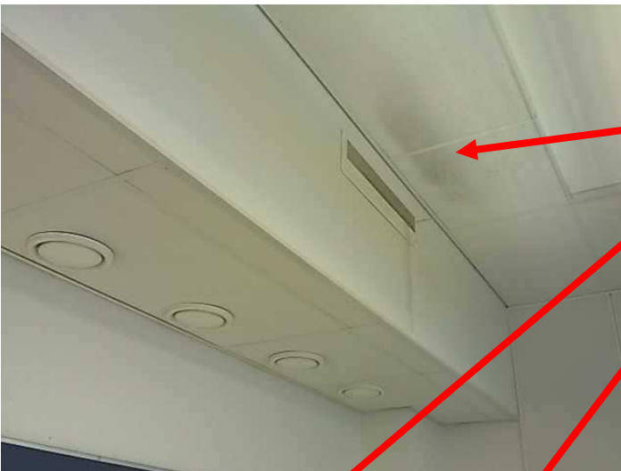
Tuloilmanvaihtoventtiilien edustalla havaittiin likaa.