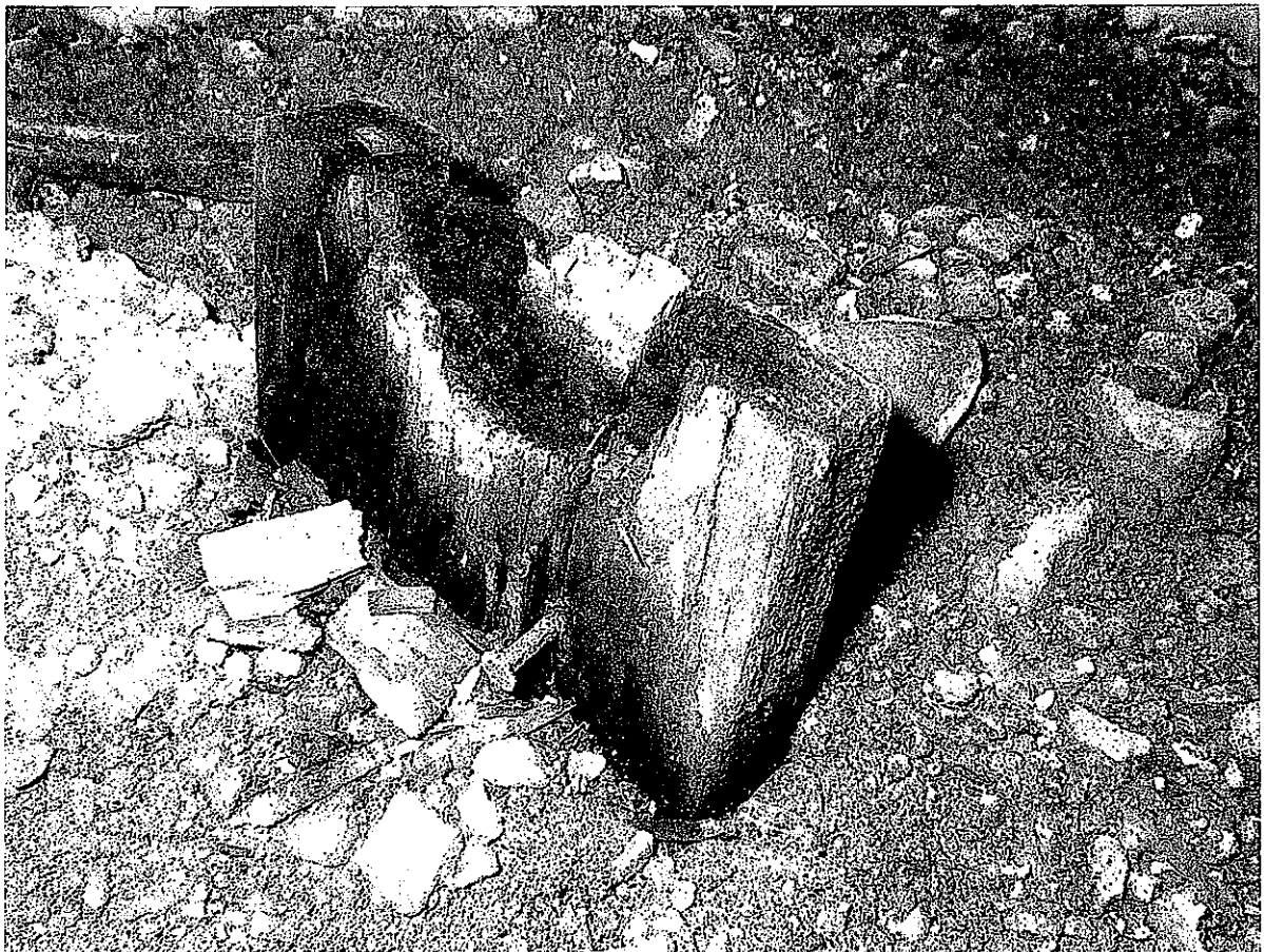
MAASSA OLEVA PUUTAVARA ON KOSTEUSVAURIOITUNUTTA, KUVA 4.