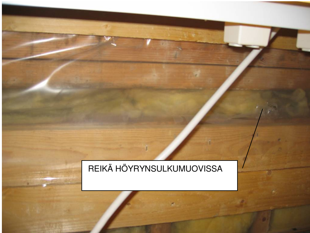
3 YLÄPOHJAN HÖYRYNSULKU TILAELEMENTIN SAUMAN KOHDALTA