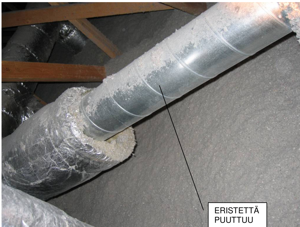
6 ILMASTOINTIPUTKI ULLAKOLLA