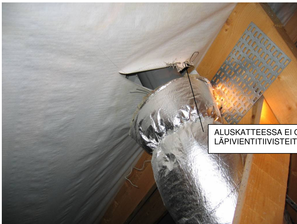
4 ALUSKATTEEN LÄPIVIENTI