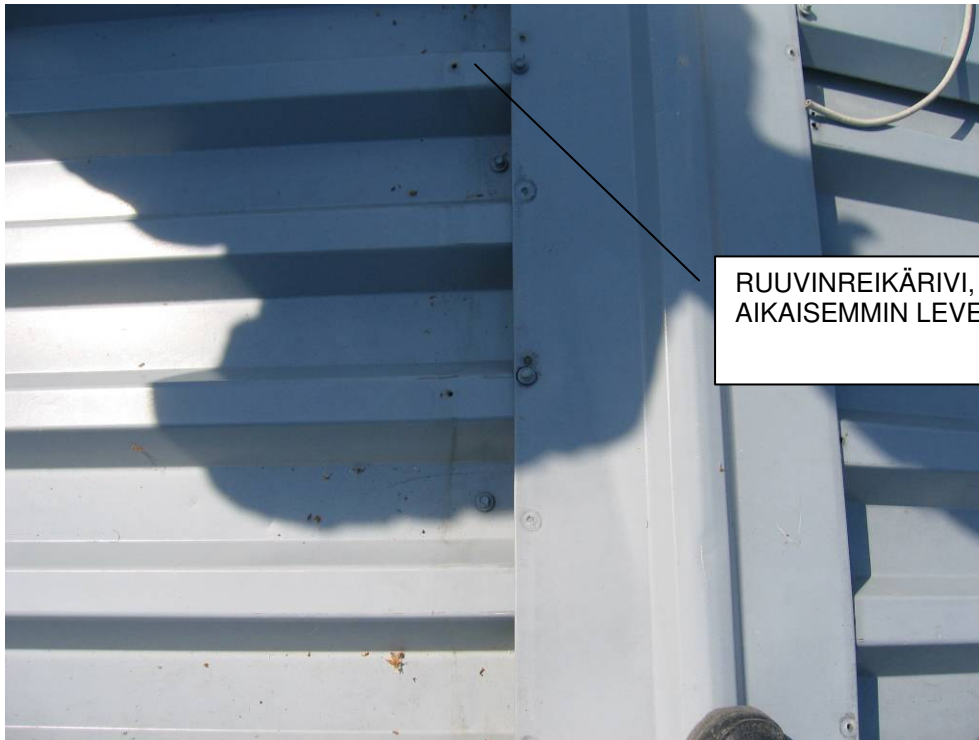
7 HARJA KUVATTUNA ALAPUOLELTA

RUUVINREIKÄRIVI, HARJAPELTI OLLUT AIKAISEMMIN LEVEÄMPI?