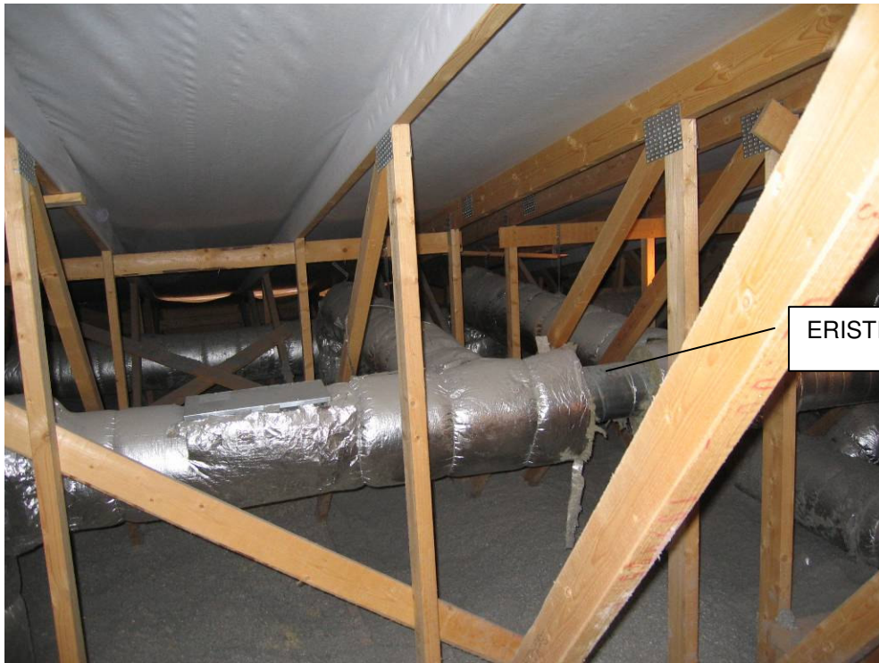
5 ILMASTOINTIPUTKI ULLAKOLLA